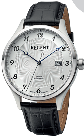
GM-2212 Edelstahl, Automatic , Saphirglas, 5 Bar UVP 298,00 €