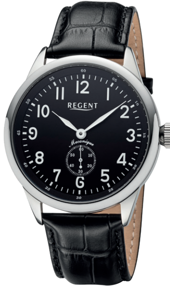
GM-2201 Edelstahl, Handaufzug , Saphirglas, 5 Bar UVP 268,00 €