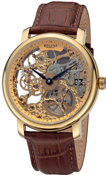
GM-2204 Edelstahl IPG, Handaufzug , Saphirglas, 5 Bar UVP 428,00 €