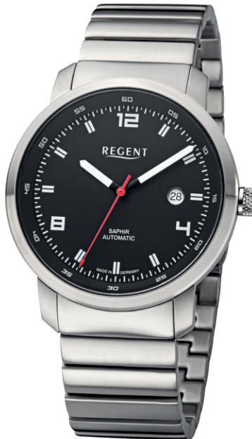
GM-2106 Edelstahl, Automatic, Saphirglas, 5 Bar UVP 438,00 €