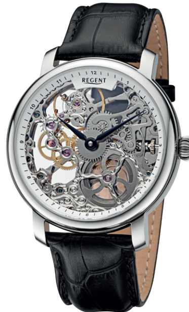
GM-2205 Edelstahl, Handaufzug , Saphirglas, 5 Bar UVP 398,00 €