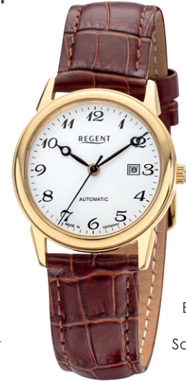
GM-2208 Edelstahl IPG, Automatic, Saphirglas, 5 Bar UVP 258,00 €