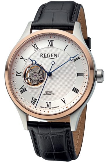
GM-2217 Edelstahl IPR, Automatic , Saphirglas, 5 Bar UVP 348,00 €