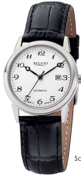
GM-2207 Edelstahl, Automatic, Saphirglas, 5 Bar UVP 238,00 €