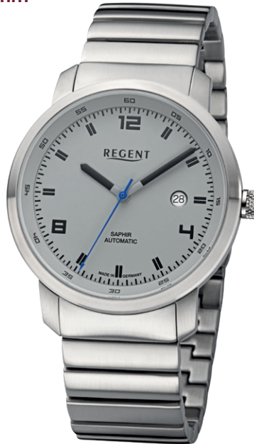
GM-2107 Edelstahl, Automatic, Saphirglas, 5 Bar UVP 438,00 €