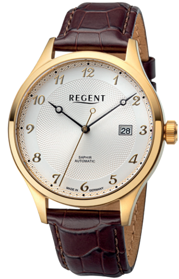
GM-2214 Edelstahl IPG, Automatic , Saphirglas, 5 Bar UVP 328,00 €