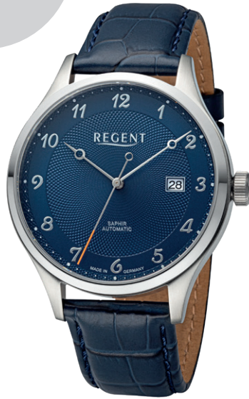
GM-2213 Edelstahl, Automatic , Saphirglas, 5 Bar UVP 298,00 €