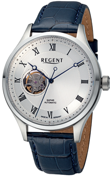
GM-2215 Edelstahl, Automatic , Saphirglas, 5 Bar UVP 328,00 €