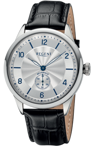
GM-2202 Edelstahl, Handaufzug , Saphirglas, 5 Bar UVP 268,00 €