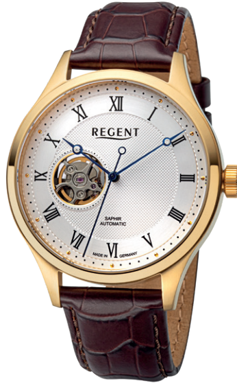
GM-2216 Edelstahl IPG, Automatic , Saphirglas, 5 Bar UVP 348,00 €