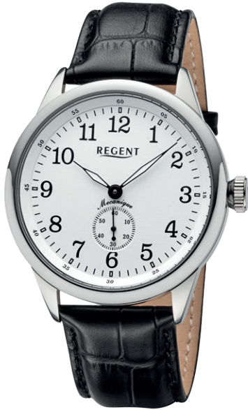
GM-2200 Edelstahl, Handaufzug , Saphirglas, 5 Bar UVP 268,00 €